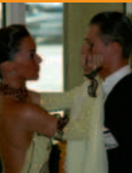
Kleines Foto oben: Er soll doch schön aussehen!