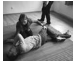
Vereine sind gut beraten, ihre Trainer und Ehrenamtlichen regelmäßig zu Erste-Hilfe-Schulungen zu schicken.

vid, Vereins- und Informationsdienst, Januar 2020