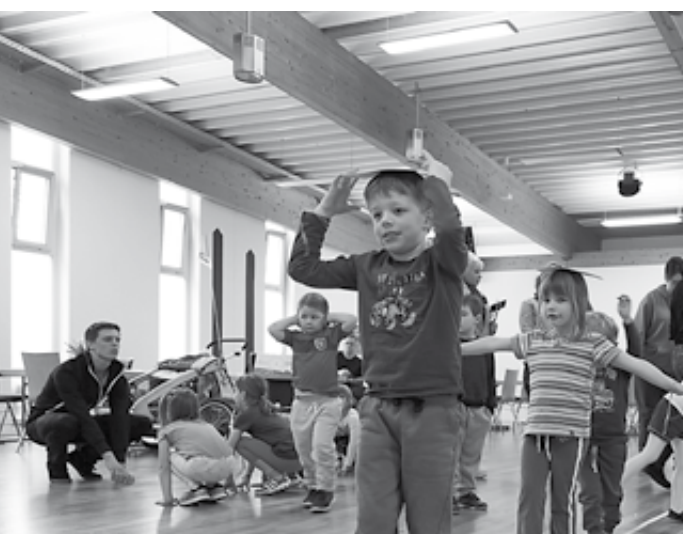
Hochkonzentriert und mit viel Freude gingen die Kinder an ihre Bewegungsaufgaben

Der Renner beim Winter-Kibaz war die Siebertreppe. Selbst die Kleinsten hüpften mutig vom „Einer“. An die 60 Kinder im Alter von zwei bis sieben Jahren waren am 12. März 2016 mit ihren Angehörigen ins Tanzsportzentrum der Residenz Münster gekommen, um das Kinderbewegungsabzeichen, das „Kibaz“ zu erwerben. Eingeladen waren Kinder aus dem eigenen Verein sowie aus den umliegenden Kindertagesstätten. Darunter waren auch drei syrische Flüchtlingskinder, die voll integriert waren und mit viel Freude und Begeisterung mitmachten. Die Aktion stand unter dem Motto „NRW bewegt seine Kinder“, wurde von der Sportjugend des Landessportbundes Nordrhein-Westfalen angeregt und mit Hilfe der Stadtsportbundjugend Münster gefördert. Ohne Zeit- und Leistungsdruck erledigten die Kinder in einem Parcours aus zehn Stationen kleinere, dem jeweiligen Alter und der kindlichen Persönlichkeitsentwicklung angepasste Bewegungsaufgaben. Die sportlichen Aufgaben orientierten sich an der motorischen