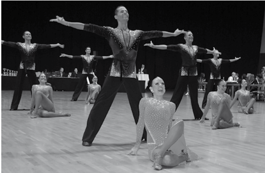
FG TSZ Aachen TD TSC Düsseldorf Rot-Weiß A

mal steigern. So traf etwas ein, was es so in den vergangenen Jahrzehnten in der Geschichte der Bundesliga noch nie gegeben hat: Die Dritt- und Viertplatzierten der Deutschen Meisterschaft erreichten einen geteilten 2./3. Rang und konnten den deutschen Vizemeister auf Rang vier verweisen. Dabei galt nach dieser Wertung das Motto: Wenn Zwei sich streiten, freut sich nicht unbedingt der Vierte.