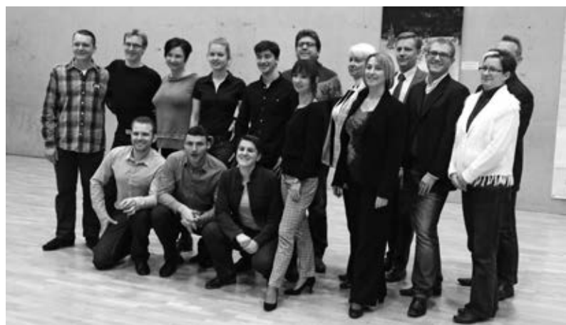
Team Berlin mit der Prüfungskommission.