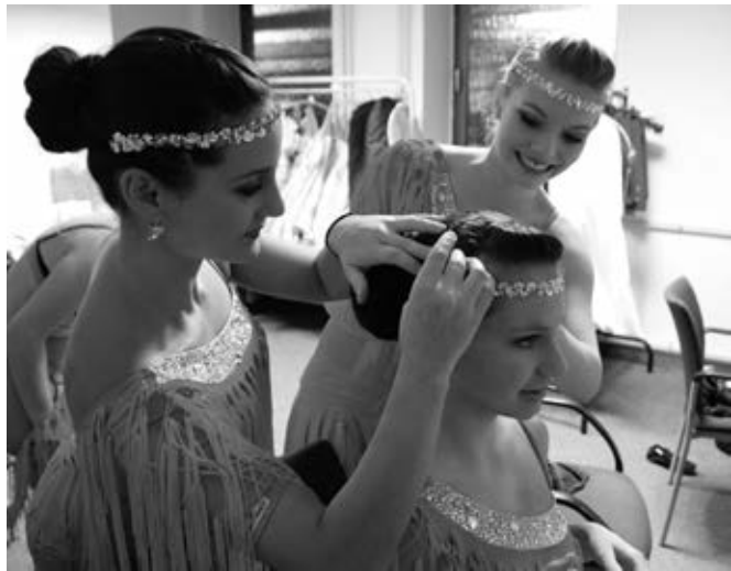
Vorbereitung (links) und Auftritt: Die „Großen“ präsentieren den Jive.

Am 20. Dezember öffnete sich zu zwei Veranstaltungen der Vorhang für 120 Kinder, Jugendliche und Jungerwachsene. Die Zuschauer konnten sich auf weihnachtliche Klänge, ein wunderschönes Bühnenbild und Lichteffekte, die die zauberhafte Tanzkleidung der Brillanten zusätzlich zum Funken bringen, freuen.