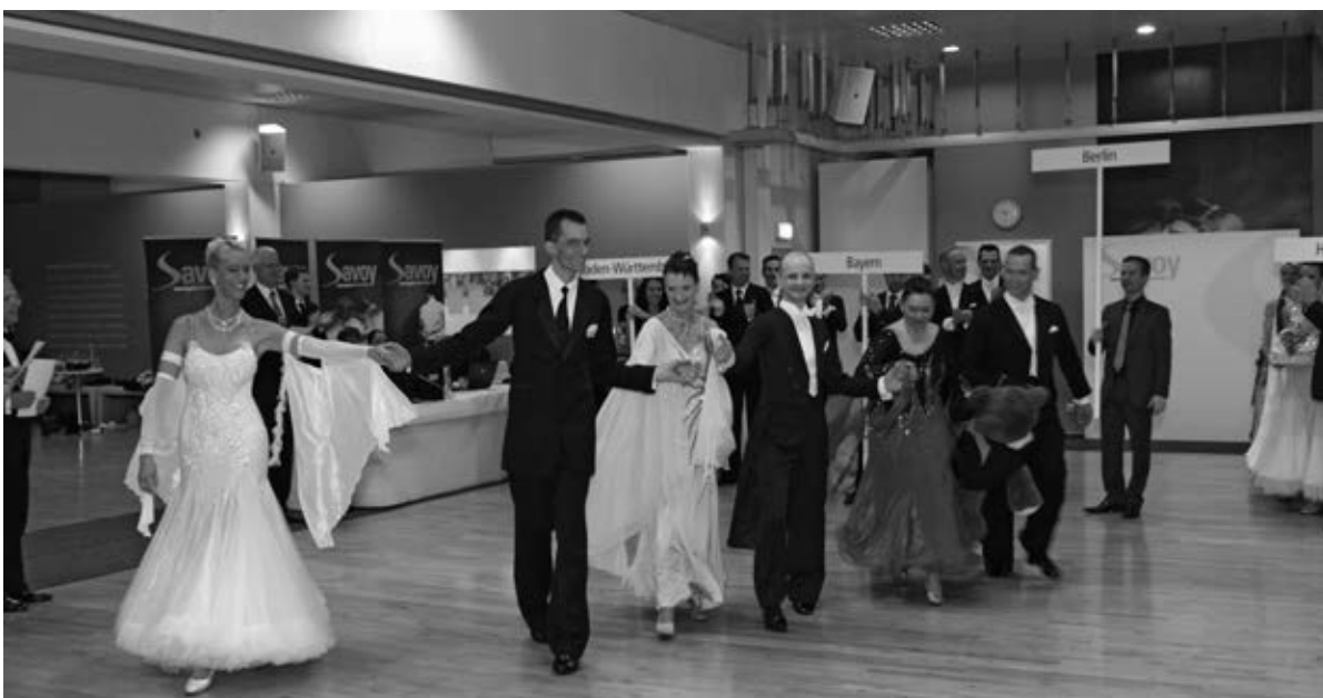
Ihren Spaß hatten sie, die Berliner in München.