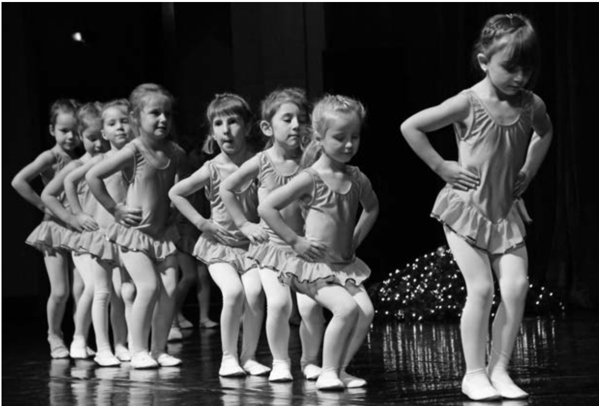
Auch die Jüngsten sind voll konzentriert.