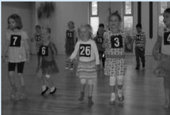
Tanzsternchen- Abnahme