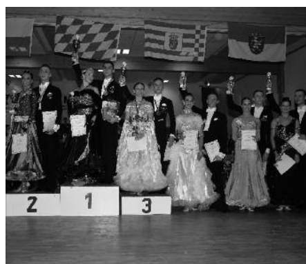
Siegerehrung der Deutschen Meisterschaft Jugend A-Standard