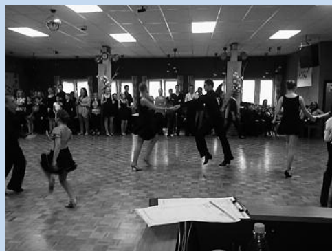
Bailando-Turnier im TTC Oberhausen