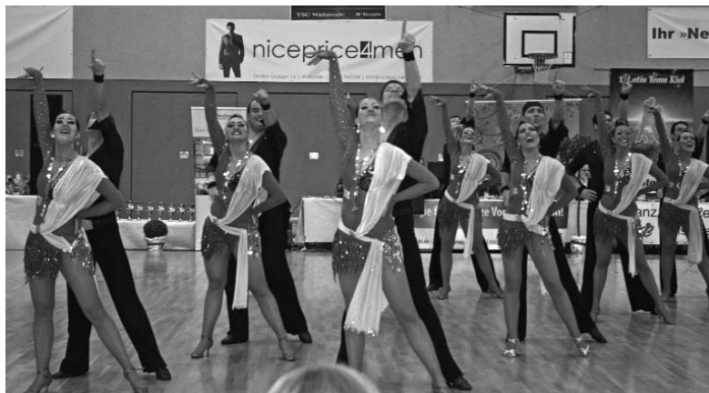
Die Sieger in der Landesliga: TSA im Ellerbeker TV.