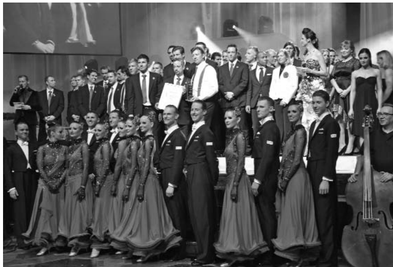
Zweiter Platz bei der Wahl zur Mannschaft des Jahres in Niedersachsen: Der Braunschweiger TSC.