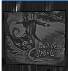
Ein Bild aus(f) Sand gemalt.