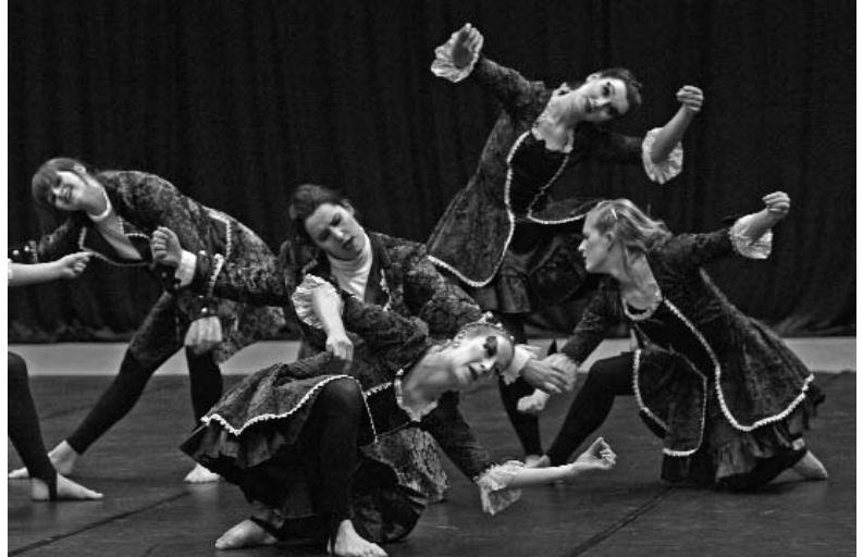
Sieger in der Regionalliga: die Dream Dancer (TSV Wendezelle).

In der Regionalliga vertreten fünf Teams die Farben Niedersachsens. Ihre vier Mitkonkurrenten um den Aufstieg kommen aus Bremerhaven, Hamburg und Berlin. Der frühe Saisonstart war für Choreographen, Trainer und Teams ganz sicher eine Herausforderung. Und daher wirkte manche Darbietung noch nicht ganz ausgereift. So war es für das fünfköpfige Wertungsgericht zweifelsohne keine leichte Aufgabe, was sich auch in den gemischten Wertungen für alle Endrunden-Teams wiederfand.