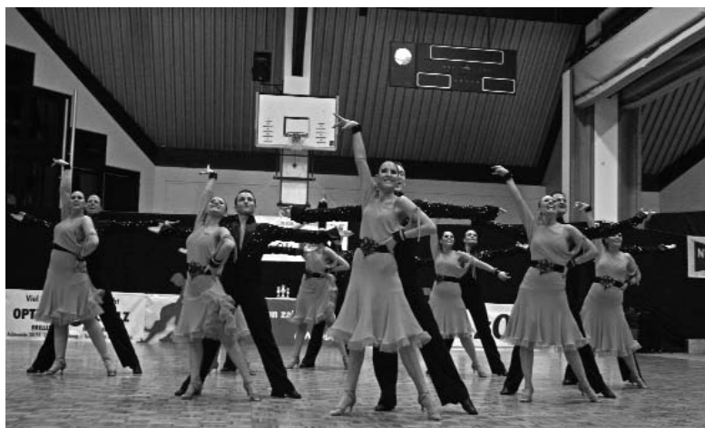
Zweiter Platz in der Oberliga: Oldenburg B.

Alle Ergebnisse und Tabellen unter www.formationen.de