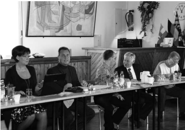
Der TSTV-Vorstand bereitet sich auf die Mitgliederversammlung vor.

Uwe Hinrichs kam 1960 mit dem Tanzen in Verbindung und startete mit seiner Ehefrau