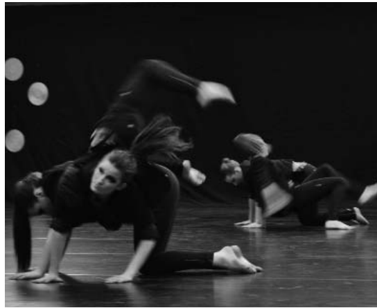
Platz zwei: J.E.T. aus Goslar.