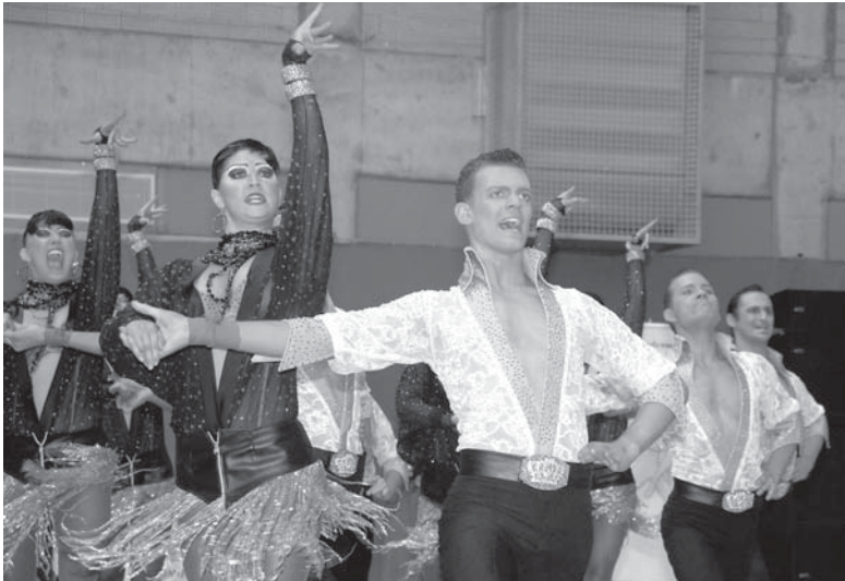
T.T.C. Rot-Weiß-Silber Bochum A

wie dieselbe Musik von unterschiedlichen Mannschaften interpretiert und vertanz wurde.