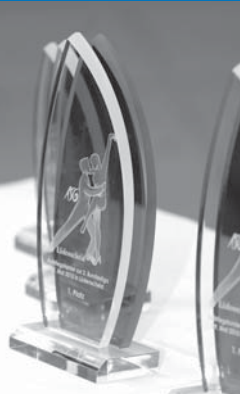
Diesen Pokal galt es zu gewinnen