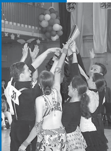
Dritter Sieg in Folge beim Teammatch