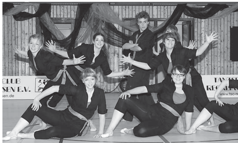
„Infinity“ TSC Blau-Gold Castrop-Rauxel

Den sechsten Platz ertanzte Dance Union (Hochdahl). Mutig verließ die Formation ihr Erfolgsrezept, das in den letzten Jahren durch „Leiden und Verzweiflung“ geprägt war und zeigte mit dem Stück „chambermaid swing“ eine neue choreografische Facette.