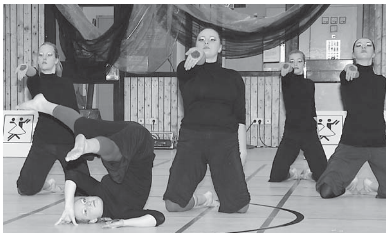
„Siyanda“ TSA im TV Unterbach

Zur Musik von Emiliana Torrini „Dead Things“ zeigte die Mannschaft Armonia (Weiden) eine ansprechende Darbietung und erreichte den fünften Platz. Obwohl Staccato (Lohmar) am ersten Saisonturnier nicht teilgenommen hatte, sorgte nicht zuletzt der vierte Platz in diesem Turnier für eine Platzierung im Mittelfeld der Liga. Auf JMD-Turnieren sind eher selten Opernklänge zu hören. Prestissimo (Leverkusen) unterstrich in außergewöhnlicher Art und Weise zu einer Arie von Maria Callas zum Thema „Trennung“, dass JMD und Oper durchaus harmonieren. Belohnt wurden die Leverkusener mit dem dritten Platz. Zur Filmmusik „Der Krieger und die Kaiserin“ präsentierte Dance Magic (Hochdahl) gekonnt seine Präsentation.