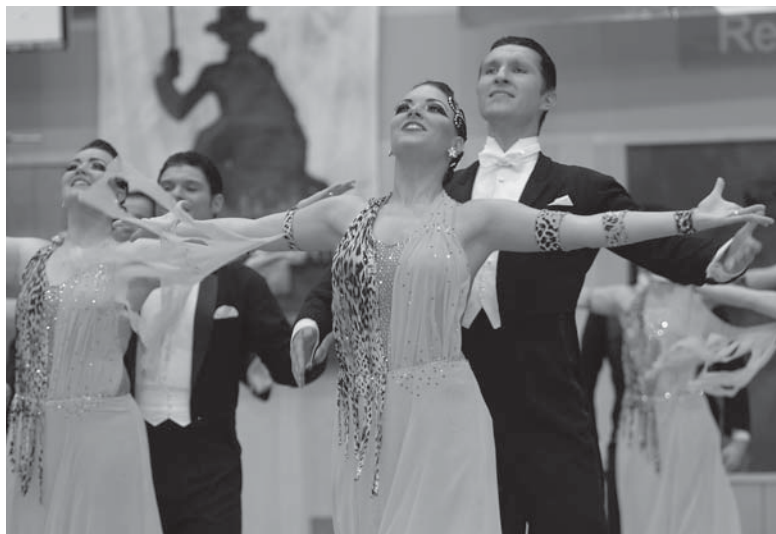
Step by Step Oberhausen B

Die Mannschaft des Boston-Club Düsseldorf, der zweite Vertreter des TNW, ging schon in der Vorrunde auf Angriff. Sie zeigte ihr Thema „Mary Poppins“ präzise und mit viel Ausstrahlung,