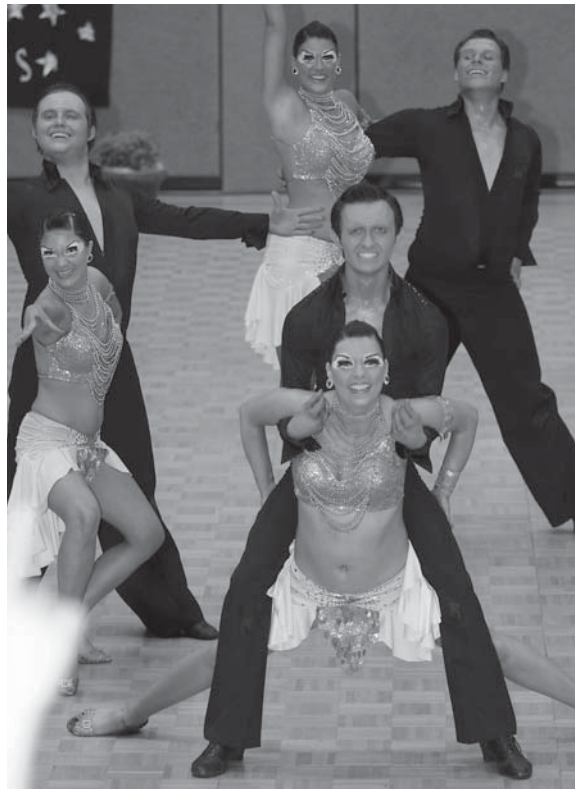
Ruhr-Casino des VfL Bochum C

Den dritten Platz ertanzte sich erstmals in dieser Saison die Mannschaft des TSK Schwarz-Gold Oberhausen. Mit Move punkteten die Tänzer mit viel Power und toller Ausstrahlung und verbesserten sich so von Turnier zu Turnier in der Platzierung. Platz zwei ging erneut an die TSG Balance Wesel. In der Endrunde steigerten sich die Paare und boten eine synchro-