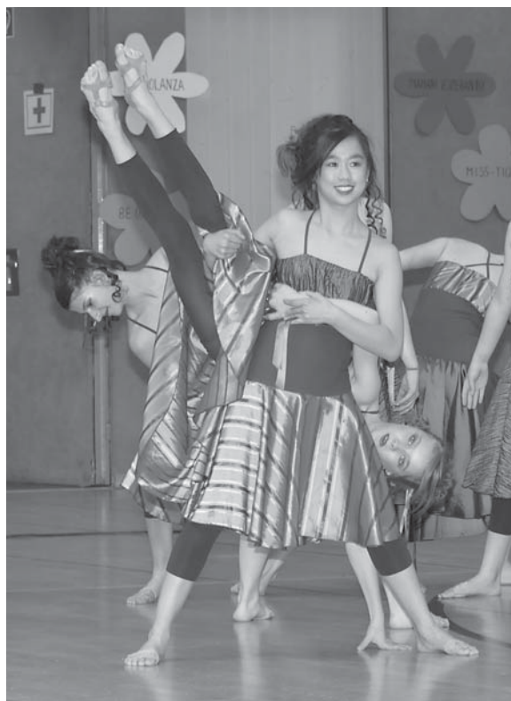
„Esperanza“ TSV Kastell Dinslaken

Als dritter Anwärter präsentierte sich Shukura (Unterbach). Diese befanden sich auf der Suche nach der Mörderin ihrer Freundin und fragen sich ebenfalls – war es sie, oder sie? Das Ergebnis fiel am Ende eindeutig aus: Es-