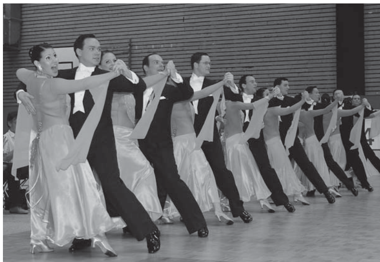
Boston-Club Düsseldorf A