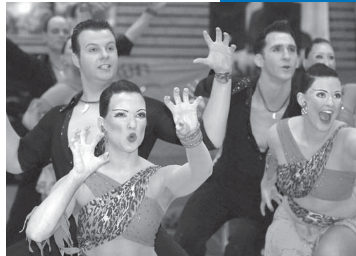
TSG Balance Wesel A