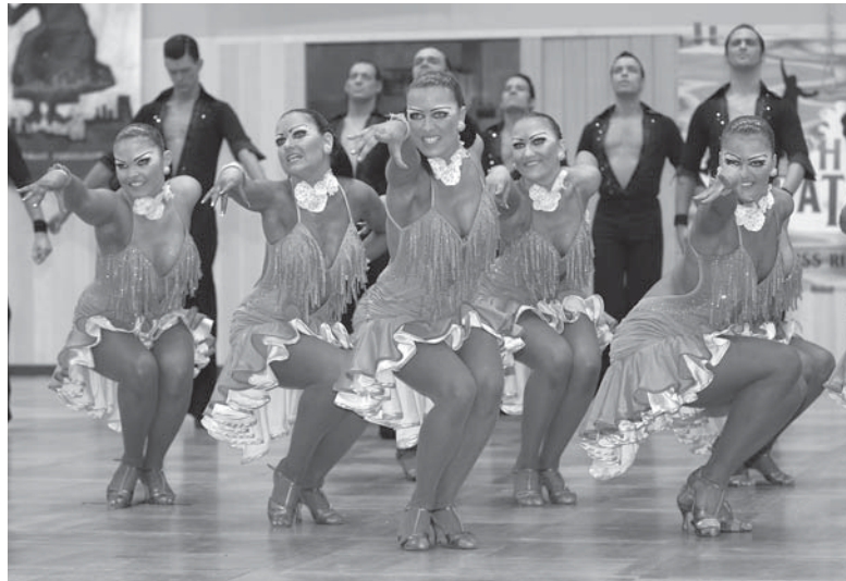
TTC Rot-Weiß-Silber Bochum A

Die Plätze eins bis vier waren hart umkämpft und wie die Wertungen zeigten, lagen die Leistungen der Teams sehr dicht beieinander. Den vierten Platz belegte die Mannschaft mit den meisten Einsen in der Wertung, das C-Team des Grün-Gold-Club Bremen. Das Team zeigte eine sehr tänzerische Leistung, allerdings