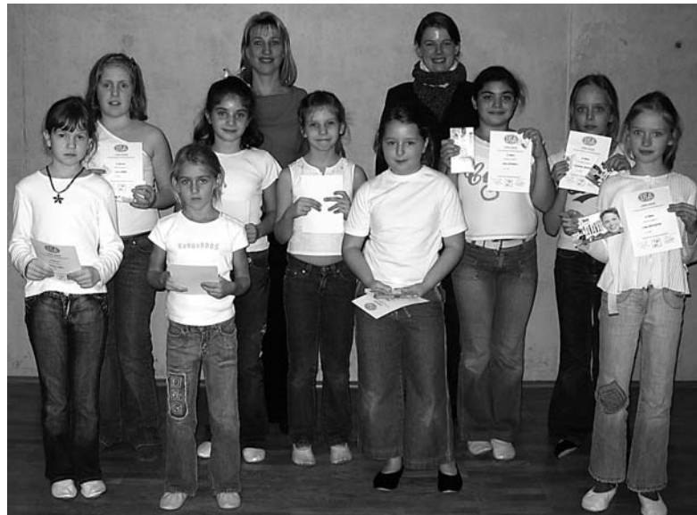
Einzel und in Gruppen trat die Tanzsportjugend zur DTSA-Abnahme an.