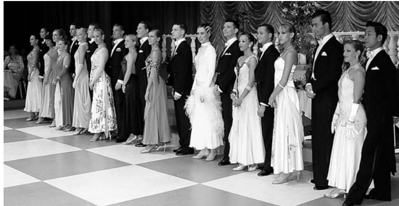
Startklar: die Standardpaare.

er an diesem Abend mit der Verleihung der Ehrenmitgliedschaft samt Schärpe in den Ruhestand verabschiedet. Gleiche Ehrung wurde einem langjährigen behinderten taubstummen Stammgast zuteil, der die Musik nur über Schwingungen wahrnehmen kann.