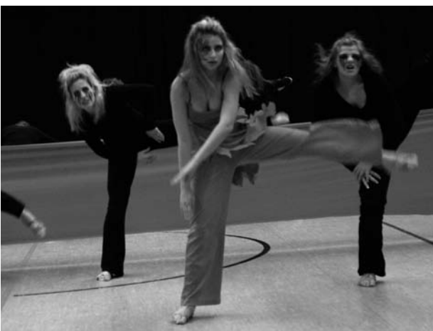
Links die Dirty Angels (dritte in der Pflicht), rechts die Kombinationssieger: Les Papillons vom TSV Rudow.