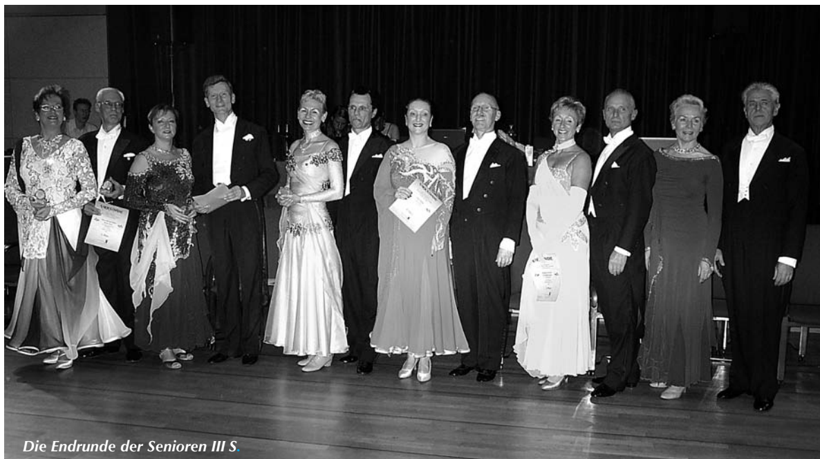
Die Endrunde der Senioren III S.