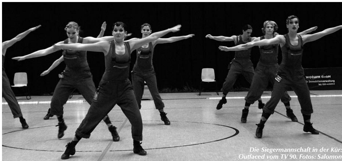
Die Siegermannschaft in der Kür: Outfaced vom TV 90.