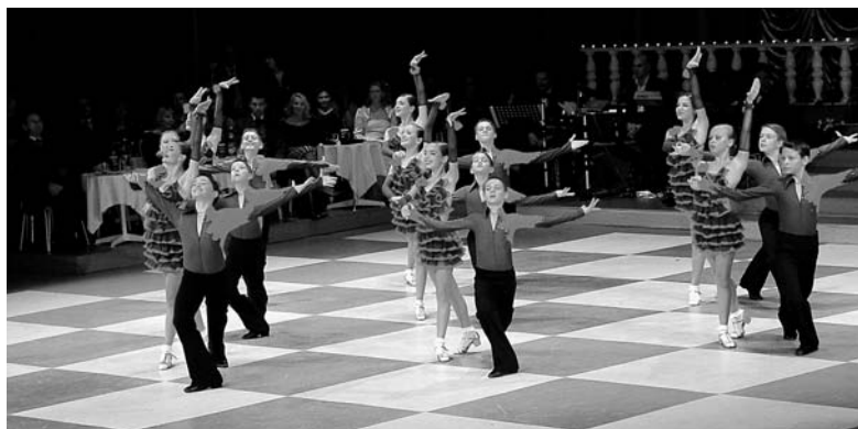
Die Petersburger Kinderformation.

Termin im nächsten Jahr: 27. Oktober 2007