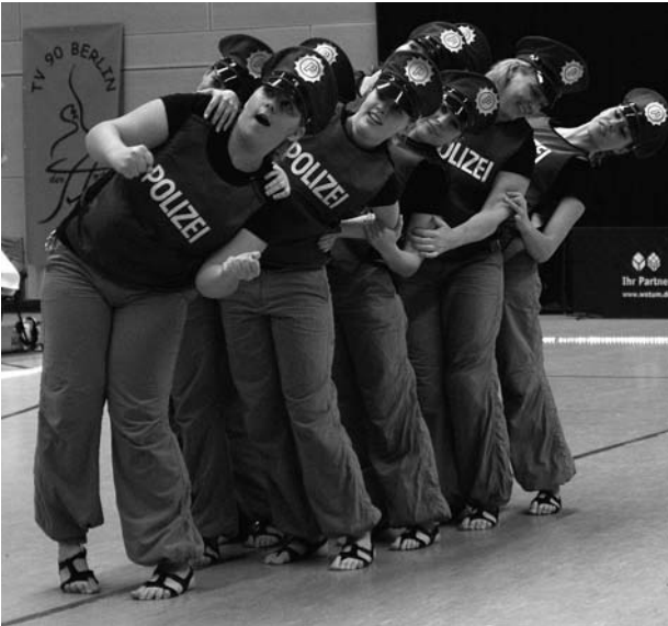
Die Ladykracher auf dem dritten Platz.

bildete und das Turnier mit einiger Verspätung begann. So konnten alle Zuschauer von Anfang an dabei sein und die vollen Ränge sorgten schließlich für beste JMD-Stimmung. Und ein Team erhielt besonders viel Applaus: "Outfaced" vom Tanzverein 90 gewann den Meistertitel in der Kür. Im Kern der Gruppe sind es viele Tänzer aus den beiden Vorjahren, als der Verein mit „The Face meets in-FARATOX“ jeweils in der Kür gewann. In dieser Darbietung stimmte einfach alles, was die Zuschauer mit großem Applaus und die Wertungsrichter mit fünf Bestwertungen honorierten. Für den Doppelsieg des Vereins sorgte das zweite Team "der Art".