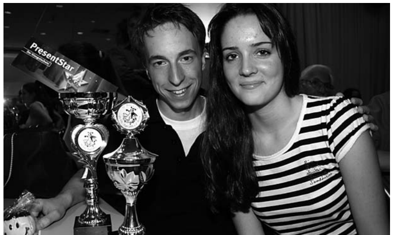
Beim Blau-Gold: Heute noch Breitensportsieger, morgen vielleicht auf DTV-Turnieren erfolgreich.

Das Vereinsheim - von vielen anderen Veranstaltungen Besucheranstürme schon gewohnt - drohte aus allen Nähten zu platzen, als die Tanzfläche von absolutem Anfänger bis hin zum S-Klassen-Turnierpaar vier Stunden lang malträtiert wurde. Für die Nicht- oder Noch-Nicht-Selbertänzer gab es