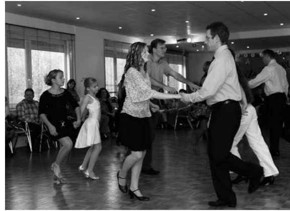
Beim SSC Südwest gab es Tänze aus aller Welt (links),