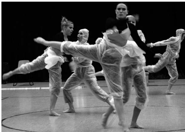
Zweiter Platz: der Art, ebenfalls vom TV 90.

Zum anderen die Tatsache, dass die Anzahl der Formationen, deren Tänzerinnen jünger als 16 Jahre sind, gestiegen ist. Doch vor allem begeisterten die Ideen und die Originalität vieler Präsentationen. Nicht nur, dass die Wertungsrichterinnen am Sonntag genau jene Wertungsaspekte doppelt zu bewerten hatten (dadurch stieg der Anteil der "Showkomponenten" an der Gesamtwertung), auch die Zuschauer wissen mittlerweile, was sie erwarten können. Und so überraschte es wenig, dass die fünfzehn Formationen vor vollem Haus in der Gretel-Bergmann-Sporthalle tanzten. Der Andrang war so groß, dass sich eine lange Schlange vor dem Eingang