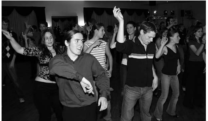
Beim Saturday Night Fever wird es voll auf der Tanzfläche des TC Blau-Gold.

Und während es draußen weiterhin bestes „Spandauer Sauwetter“ zu bewundern gab,