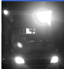
Dank schneller Rettungskräfte vor Ort wurden die verletzten Tänzer gut versorgt.