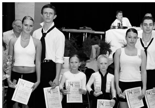
Die Sieger im Bereich Turniertanz Latein (links) und Standard (rechts).