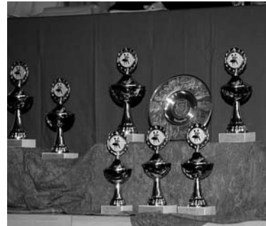
Pokale auf der Warteliste in der Balbachhalle.

Als besonderes Entgegenkommen der Gemeinde Unterbalbach wertet der Verein, dass ihm für mehrere Übungsabende in der Woche der Versammlungsraum des Ortschaftsrates zur Verfügung steht. Dafür