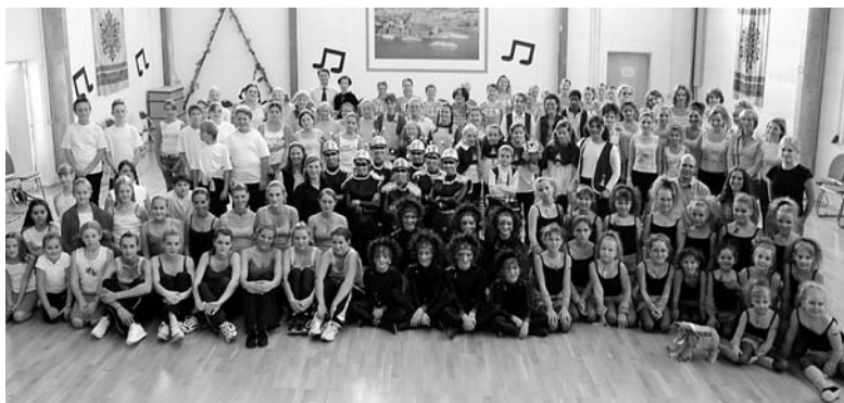
Alle Formationen des Tanzspektakels in Koblenz.

Turnierleiter Lothar Röhricht erläuterte allen die vier Wertungskriterien: Musikalität, Choreografie, Tänzerische Ausführung und Gesamteindruck, für die jeweils bis zu zehn Punkte vergeben werden konnten. Als Wertungsrichter fungierten die Trainerinnen und Trainer der teilnehmenden Gruppen, und sie machten es sich nicht einfach, wie aus den detaillierten Punktvergaben und Anmerkungen heraus zu lesen ist. Abwechselnd in Drei-