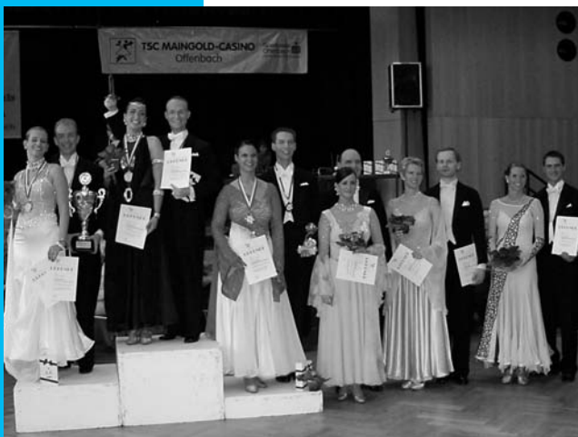
Siegerehrung für die Hauptgruppe II A.