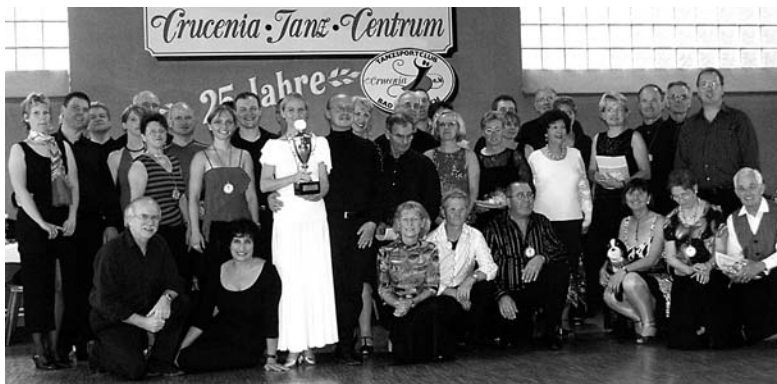
Die Teilnehmerinnen und Teilnehmer in Bad Kreuznach.

Da in Bad Kreuznach mehr "Ältere" als "Jüngere" auf die gut ausgesuchte Musik tanzen wollten, wurden die Runden wohl "gemischt" ausgelost, was sich aber nicht als