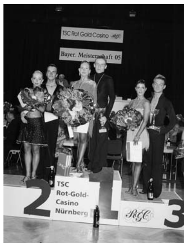
Das Treppchen der A-Klasse..

Siegerehrung für die B-Klasse.