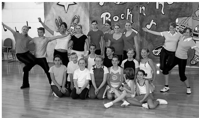
Rock'n'Roll meets Breitensport.