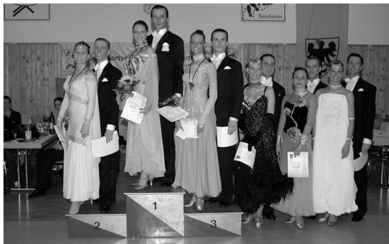
Das Finale der Hauptgruppe S-Standard.