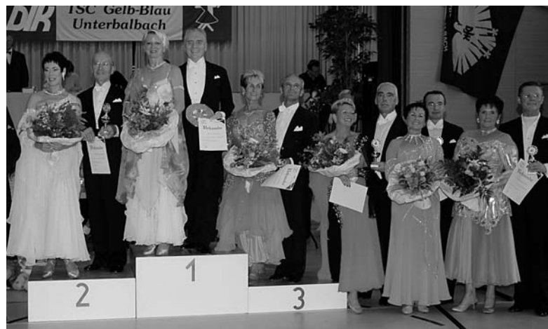
Siegerehrung für die Senioren III S.

Die Durchführungsbestimmung im Internet unter www.tbw.de - Service A-Z