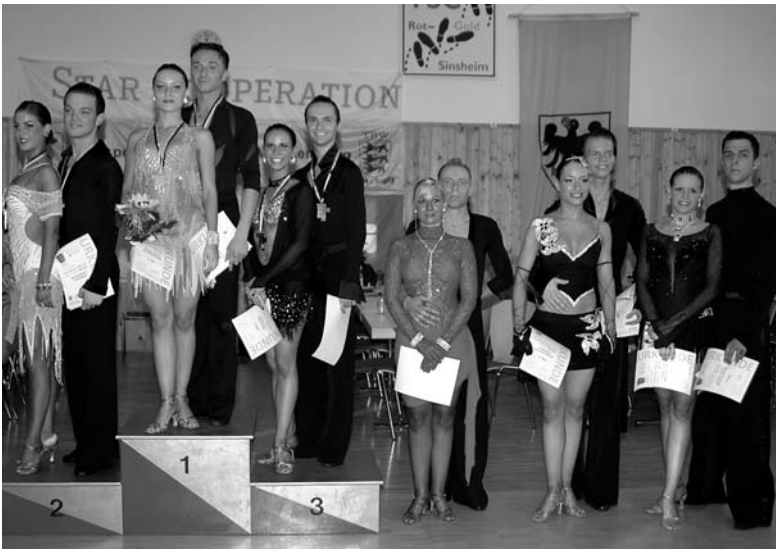
Siegerehrung für die Hauptgruppe A-Latein.