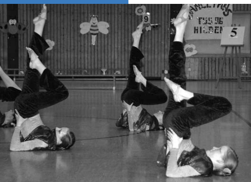
Dance Mission, JMD im TSV Hochdahl 64