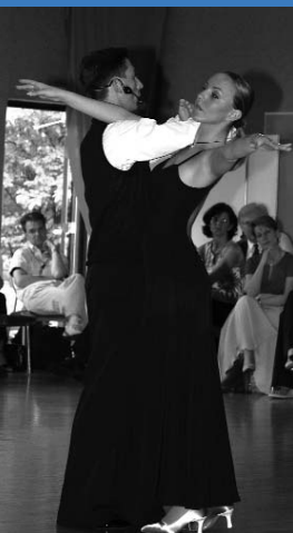
I do not cross the Monica Line...