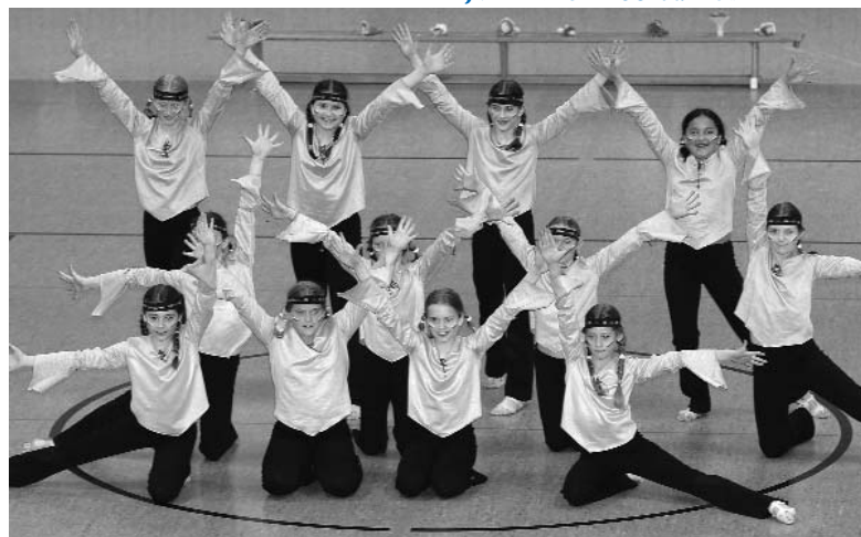
Dance Future, JMD im TSV Hochdahl 64