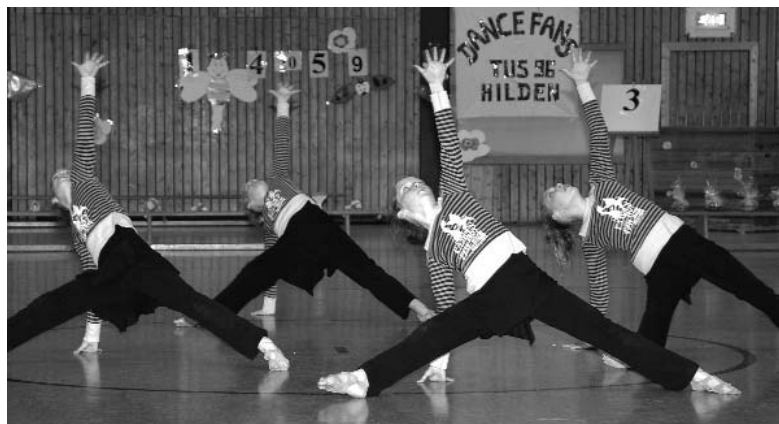
Dance Fans, TuS Hilden 96

wurde mit großer Leichtigkeit umgesetzt – Platz vier hieß es am Ende für sie.