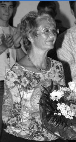
Standing Ovations minutenlang für die "Grand Dame des Tanzsports", Christa Fenn