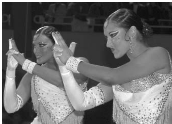
Aufgepasst: Das A-Team des TTH Dorsten

Nach einem ansprechenden Durchgang des TTH Dorsten in der Vorrunde, der vom heimi-