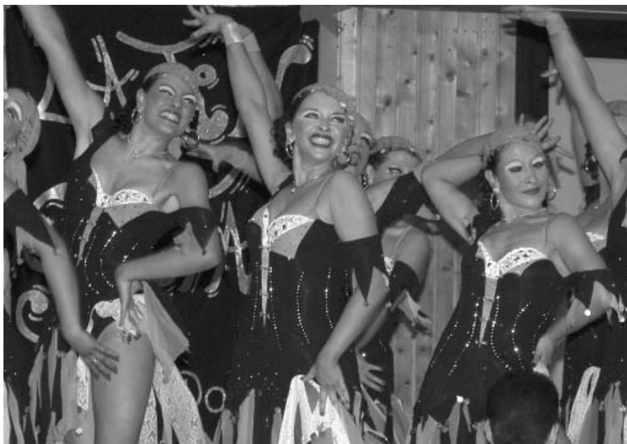
TSZ Aachen, das B-Team

In diesem Jahr kommt im Formationstanzsport ein neues Pilotprojekt beim Wertungssystem zum Einsatz. Hierbei wird zunächst die jeweils beste und schlechteste Wertung gestrichen, bevor mit den restlichen fünf Wertun-