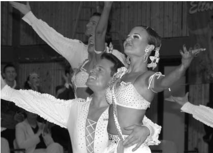
Nie kommt nur ein Funke von Unsicherheit auf, das A-Team des TSZ Aachen.

gen wie gewohnt nach dem Skatingverfahren gerechnet wird.