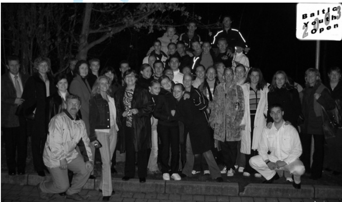
Gruppenfoto der Teilnehmer, Eltern und Betreuer der Jugendfahrt nach Rendsburg