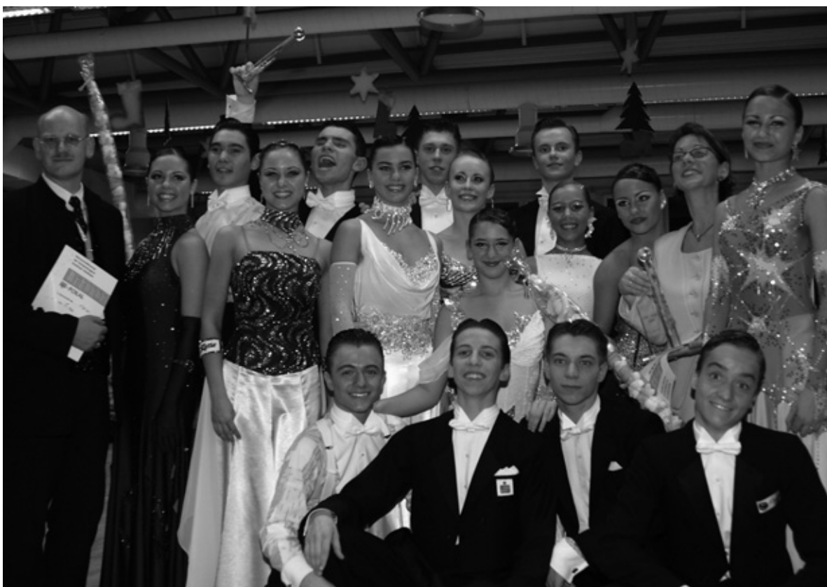
Geteilter Sieg für TNW und Sachsen: