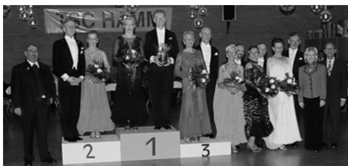
Gruppenbild der Siegerehrung mit dem Turnierleiter links sowie der Bürgermeisterin und dem Organisator des Turniers rechts