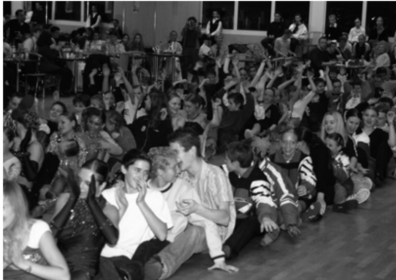
Der TNW-Pokal ist bekannt für seine zahlreichen Gruppentanzeinlagen, die von Jugendlichen und Erwachsenen gleichermaßen geliebt werden... Hier einer der Klassiker: "Lollipop"

man, Sachsen sei die unmittelbare Konkurrenz. Schon bei den Mannschaftsvorstellungen war eine sportlich gespannte Atmosphäre zu vernehmen. In der hervorragenden Titanic-Matrix-Persiflage des Teams Sachsen fing der Zweikampf bereits bei der Vorstellung an. Das Team TNW machte mit seiner Power in der "Miami Night Club"-Show, cho-