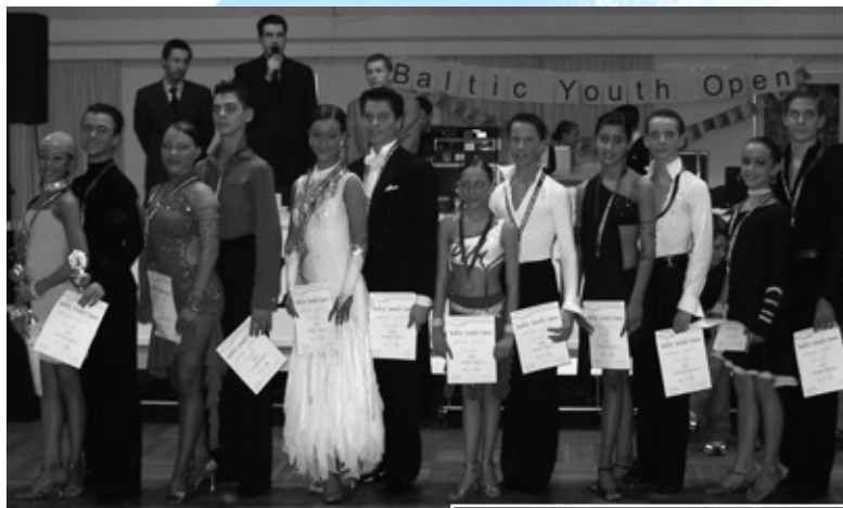
TNW-Paare bei den Siegerehrungen