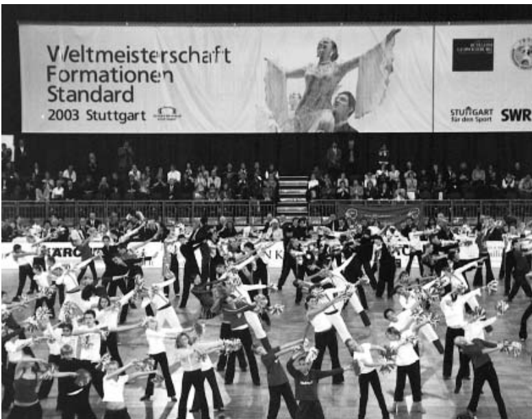
Beeindruckende Eröffnungsshow mit dem Nachwuchs aus den beteiligten Vereinen.

Vorrunde hatte um 14 Uhr begonnen. Nur gut, dass beide Mannschaften erst später dran waren.