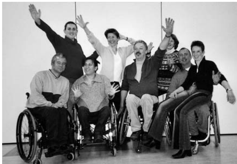
Die Sinsheimer Rollstuhlgruppe.