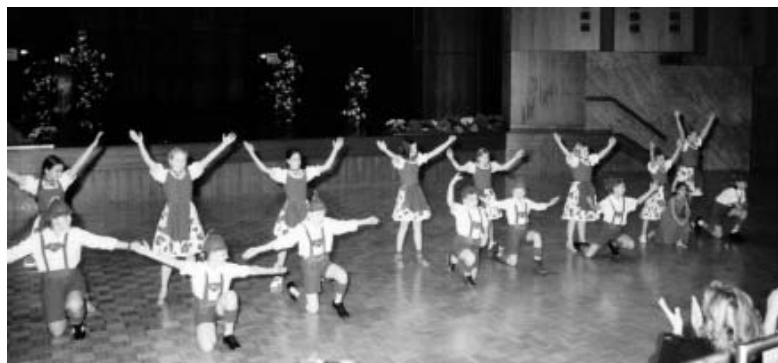
Zünftig ausgestattet traten die Kindergruppen zum Alpenrock an.

Eigentlich sollten zwölf geladene Lateinpaare die Vorrunde des Pokalturniers bestreiten. Doch binnen 24 Stunden wurden fünf Paare durch Krankheit und Verletzung so sehr getroffen, dass sie nicht antreten konnten. Also wurden Vor- und Endrunde mit allen