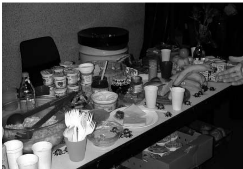
Tänzerfutter.