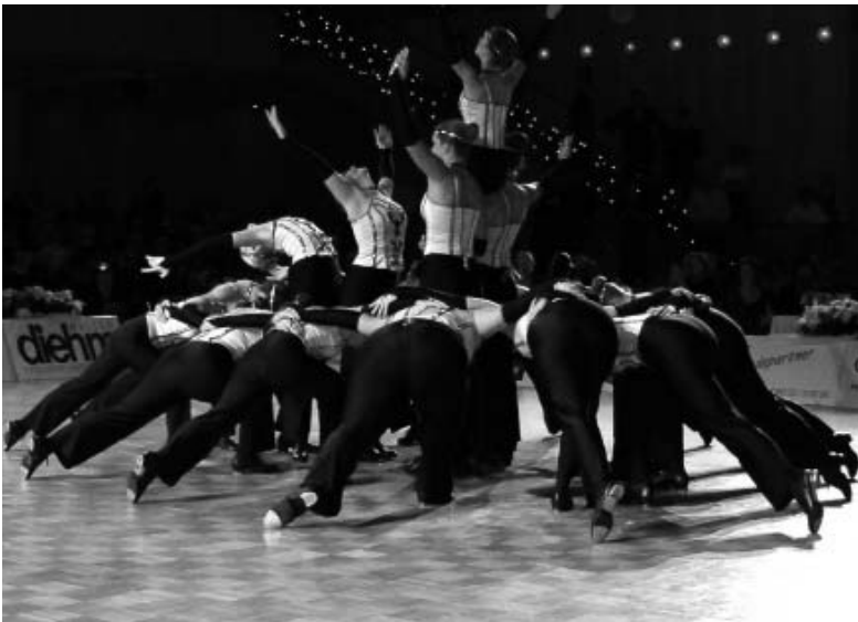
Besonders empfehlenswert: die Penguin Tappes aus Hemsbach.