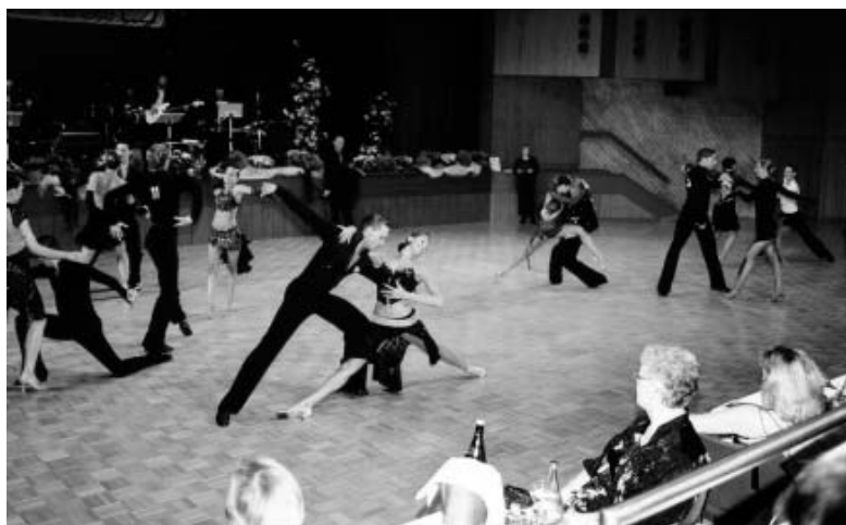
Oben: Alle Paare auf der Fläche. Unten: James Bond stand Pate beim Showblock nach dem Turnier.

Paaren getanzt. Dazwischen sorgte die Jazzformation für eine Verschnaufpause für die Paare und gute Unterhaltung fürs Publikum. Sie zeigten eine ansprechende Choreographie aus dem Musical "Tanz der Vampire".