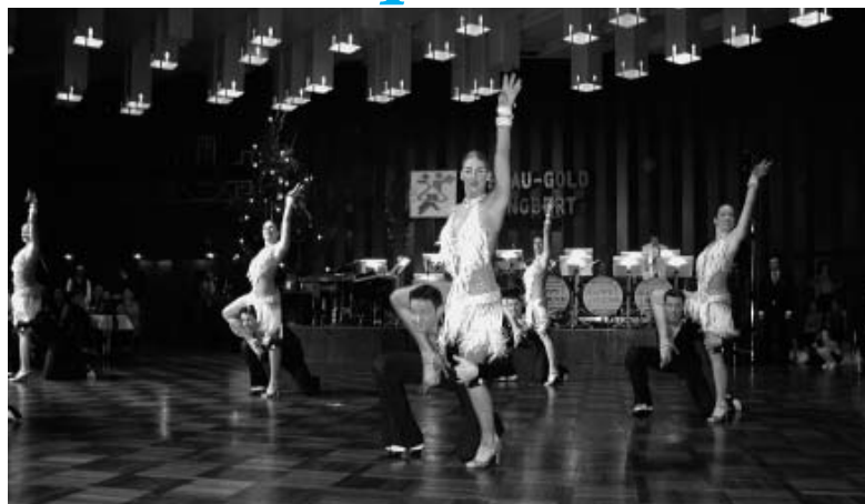
Die Düsseldorfer Lateinformation gehörte zu den Höhepunkten des Winterballs in St. Ingbert.

Zum wiederholten Mal wurde die Jazz- und Moderndance-Formation "autres choses" zur Mannschaft des Jahres im Saarland gewählt. Das Team des TSC Blau-Gold Saarlouis setzte sich mit großem Vorsprung vor den Laufreffreunden (LTF) Marpingen durch. "autres choses" war im Oktober in Essen mit dem Stück nach der Musik "Kampf der Ritter" aus Sergej Prokofiews Ballett "Romeo und Julia" zum fünften Mal in Folge deutscher Meister geworden.