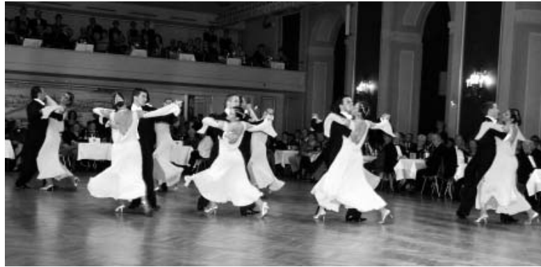
Die Mainzer Erstliga-Formation eröffnete den Ball "Mainz begrüßt Lateinamerika."