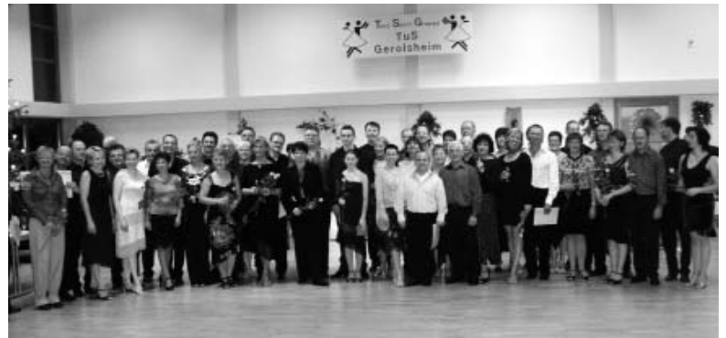
Alle Teilnehmerinnen und Teilnehmer des Wettbewerbs in Gerolsheim.