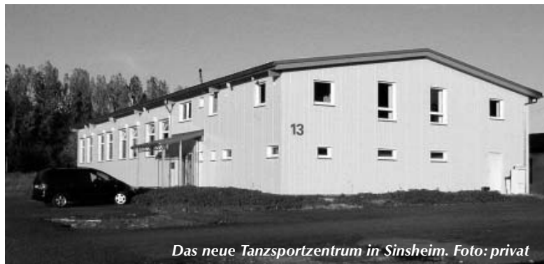
Das neue Tanzsportzentrum in Sinsheim.