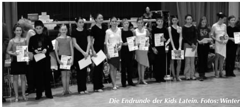
Die Endrunde der Kids Latein.