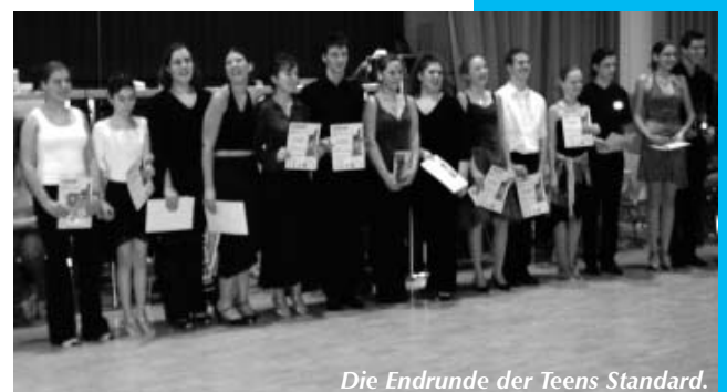
Die Endrunde der Teens Standard.