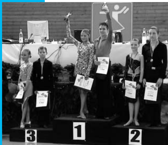
Die Junioren I B in Höfingen.