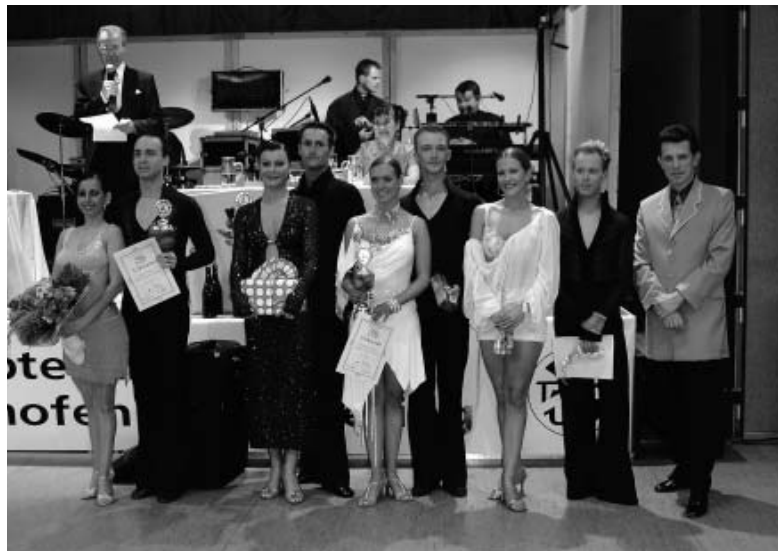
Jubiläum in Germering mit Ball und Turnieren, darunter eines für die Hauptgruppe A-Latein.