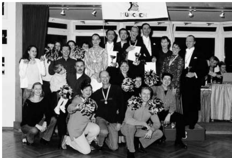
Bei den Senioren I A machten die Paare des Gelb-Schwarz-Casino München die ersten drei Plätze unter sich aus.