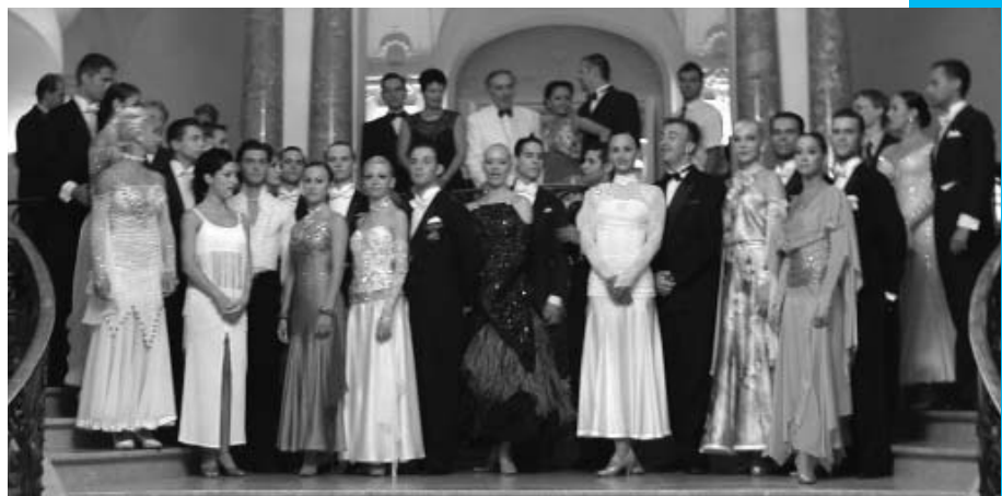
Die Paare der Tanzgala.

Die Gala begann am 28. Juli im Kongress- und Theatersaal in Bad Ischl, fand im Mondseer Schloß-Saal und im Kursaal von Bad Hofgastein ihre Fortsetzung und schloß mit den Turnieren im Alten Kurhaus von Bad Reichenhall und im Kongresshaus in Berchtesgaden am 1. August ab. Das begeisterte Publikum feuerte die Spitzenpaare aus neun