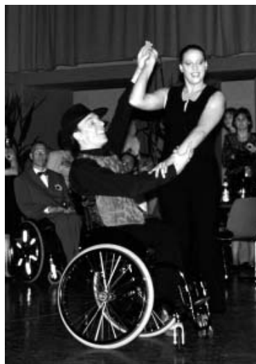
Tango-Show mit Rollstuhl.