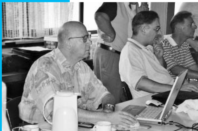
Alle Mann (und Frau) an die Computer zum Datenabgleich.