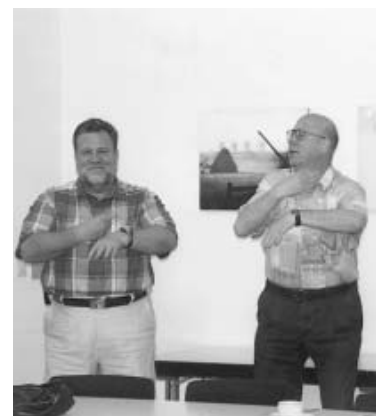
Immer schön locker bleiben!

Neunzehn Jahre sind seit dem ersten Seminar in Wangen vergangen. TBW-Präsidium und Hauptausschuss (HAS) treffen sich nunmehr jährlich im Sommer im Haus Waltersbühl in Wangen und manche Themen stehen auch 2003 noch auf der Tagesordnung: neue Angebote im Breitensport oder Seniorensport. Hinzugekommen sind die Fachverbände mit besonderer Aufgabenstellung, mit deren Vertretern im HAS ihre Probleme und Anliegen besprochen werden. Einen breiten Raum - wortwörtlich! - nehmen seit Jahren auch die PCs ein, denn während der drei Tage werden alle Geräte auf den neuesten Stand gebracht, im besonderen die TBW-