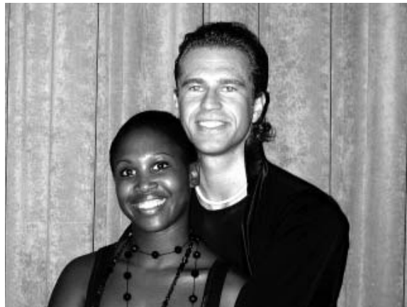
Nicht nur auf dem Parkett ein Paar.

Die Heirat in Dänemark wurde sogar von offizieller Seite empfohlen. Die Formalitäten sind einfacher und werden in Deutschland anerkannt. "Das ist dann keine große Sache mehr", versicherten die deutschen Behörden. Motsi war davon sehr beeindruckt: "Ich kann jetzt sogar ein Geschäft aufmachen."